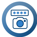
Contraseña y Fotografía